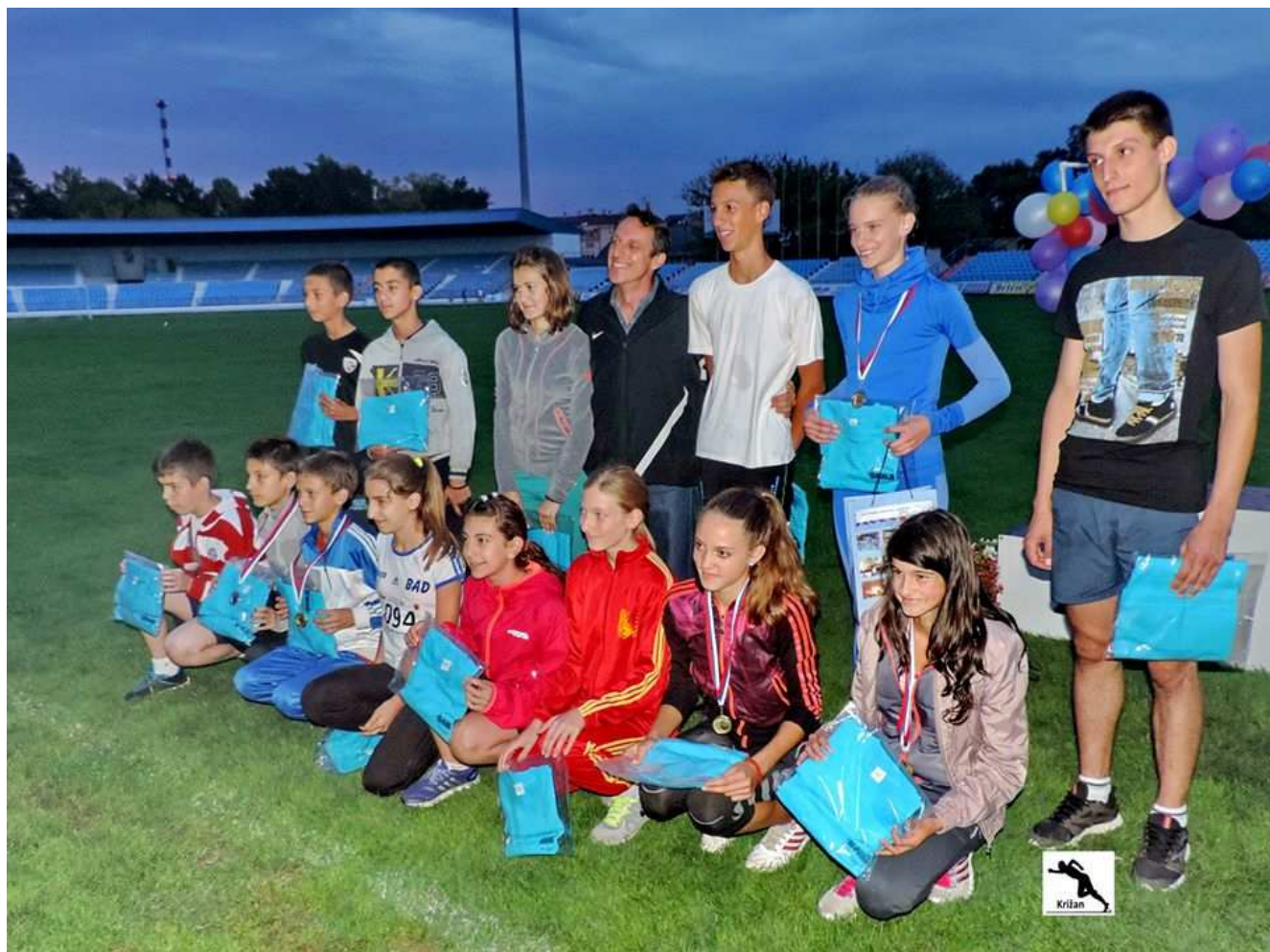
Свеукупни победници по категоријама